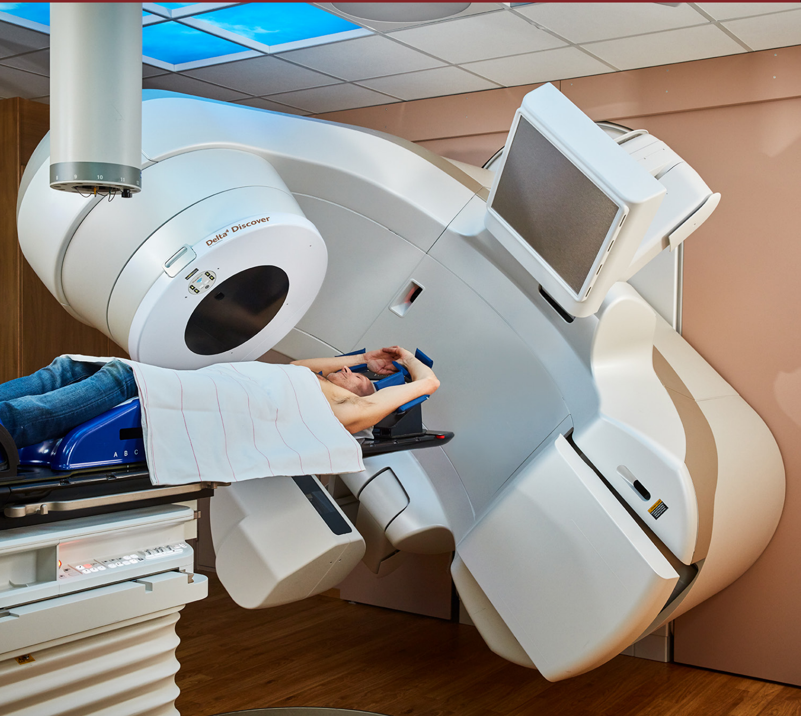
Delta 4 Discover